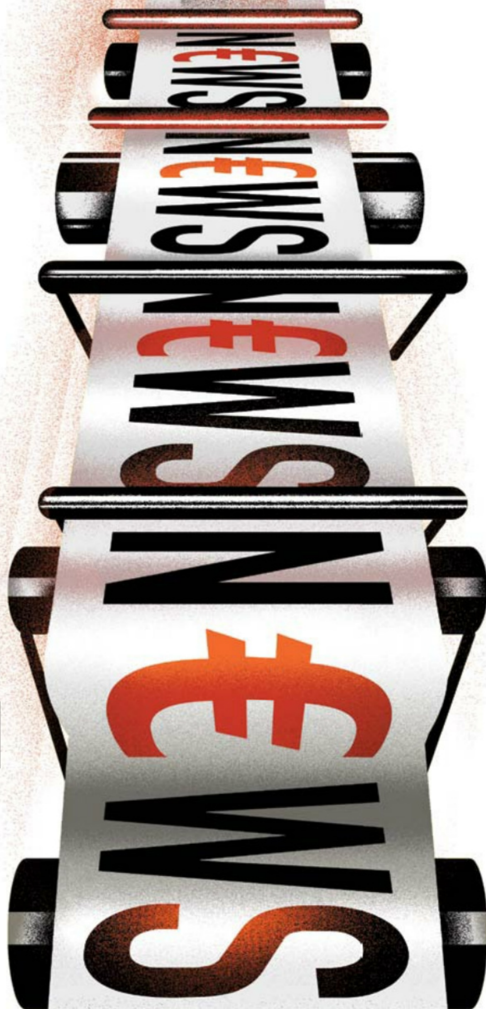
Ilustración: Raúl Arias

Nueva era para la prensa, en un nuevo intento de revitalizar un modelo en crisis. El reto: captar y fidelizar suscriptores digitales de pago. 22