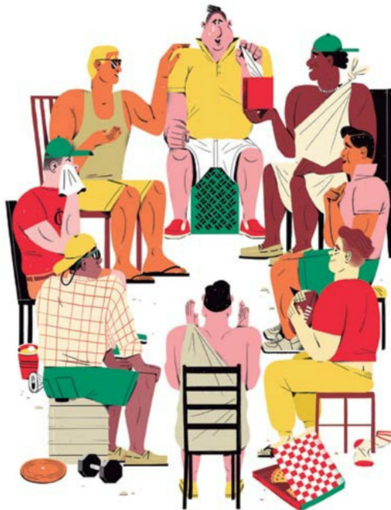
Tres muestras recientes del trabajo de Vander Yacht: arriba, dos ilustraciones para el 'podcast' The Pay Check , de Bloomberg; la de abajo apareció en la portada de la 'Sunday Review' de 'The New York Times' para ilustrar el artículo 'A frat boy and a gentleman'.